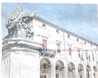
Il Comune di Rimini